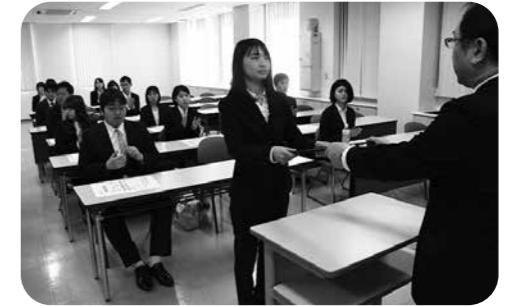
学科長より卒業証書授与