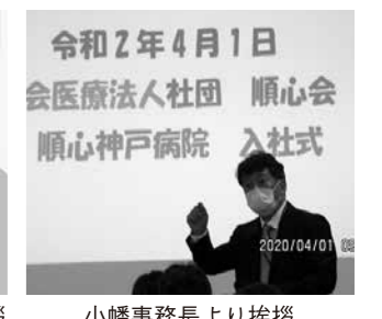
小幡事務長より挨拶