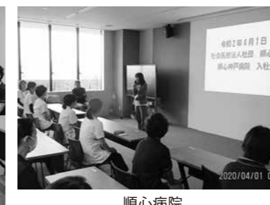
順心病院 大島看護部長より挨拶