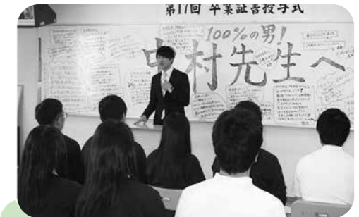
担任より卒業生へ