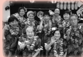
フラダンスチーム (入居者様と一緒に)