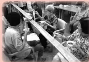
そうめん流し (本格的な竹です)