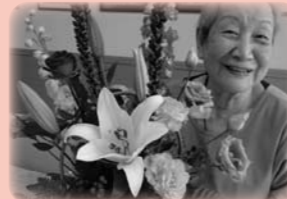
フラワーアレンジ (趣味を活かせる場)