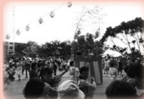
納涼祭 (一大イベント)