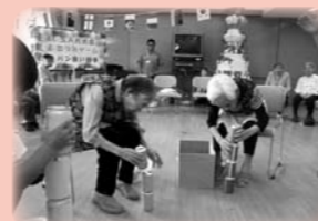
運動会 (皆様真剣勝負です)