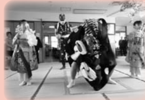
秋祭り (地域との交流)