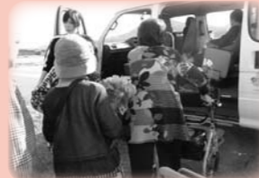
外出会 (様々な所へ出掛けます)