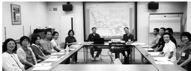
神野エリア管理者会議 8月24日開催(地域リハビリテーションセンター 中研修室)

今回の管理者会議では、神野事業用地の各施設、事業所の今後の建築スケジュールと、建物に関しては、理事長より示された3つの方針、「1. 医療・福祉の垣根が少なくなる建物にすること。2. 高齢、障害、保育など『共生』をテーマにした建物にすること。3. 将来を見据えた配置にすること。」の発表がありました。これらの方針を受けて、現在総合在宅ケアセンターの基本設計作業が始まっています。