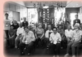
七夕会 (笹に願い事を)

※是非、お気軽にお問合せください。連絡先は一番後ろのページ(P-8)にあります。