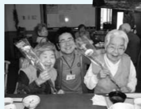
お母さん、いつもありがとう