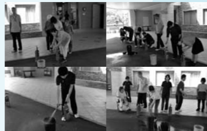
施設長を始め新人職員・利用者が自ら消火器を使っての実践～

地域との連携の下、利用者様本位の福祉サービスの提供と介護予防等在宅生活の支援に努め、地域福祉の向上に資することを目標とします。