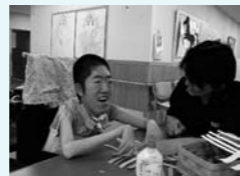
職員と一緒に作成

むさしの里では個別レクリエーションとしてかざ作りを行っています。難しい所もありますが職員と共に楽しみながら作っておられ大変好評です。