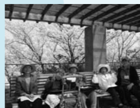
明石海峡を見下ろす公園でお花見