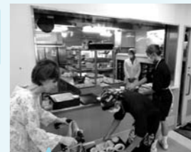
ケアハウスでの食事配膳では元気な声で挨拶していただきました。