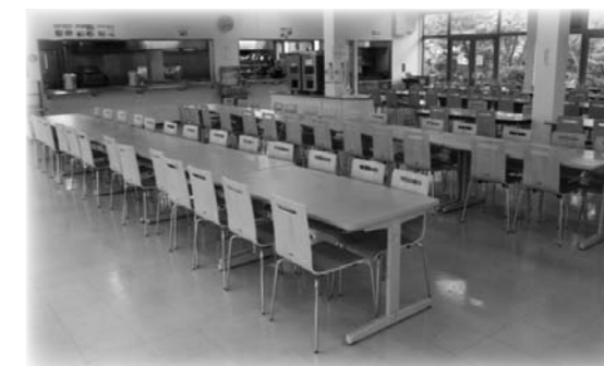
更新後(平成26年1月20日更新)