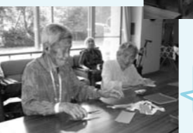
七夕の折り紙をしました