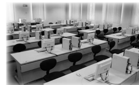
更新後(平成25年11月27日更新)