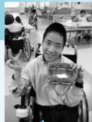
父の日へのプレゼント上手くできました。