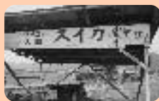
行政先生のお母さんお勤めの 日本一美味しいすいか屋さん